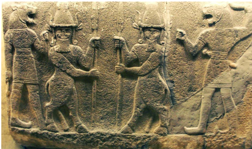
Kusarikku, l'Homme-bison, et Ugallu, l'Homme-lion sur un relief néohittite de Carchemish, vers 1200-900 av. J.-C., Musée des Civilisations anatolienne, Ankara

* Ajoutons que, tout comme l' Uridimmû », le Chien renragé », le Kusarikku , « le Bison », apparaît, dans le poème de la création, comme une des onze créatures fabuleuses et terrifiantes créées par Tiamat lorsqu'elle se prépare au combat, des monstres n'ayant aucune pitié en eux qui ne reculeraient jamais dans la bataille et susceptibles d'obéir aveuglément aux à ses ordres.