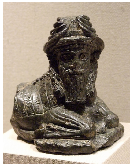
Le dieu Kusarikku, Tello, début du III ème s. av. J.-C.