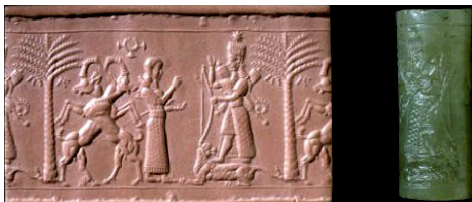
La figure d'Istar sur une empreinte de sceau assyrien daté du VII e av. J.C.

* Notons par ailleurs que l'étoile \alpha Leo est nommée LU.GAL = Šarru, qui est l'épithète du dieu Marduk, le maître du ciel à partir de la fin du II e millénaire avant notre ère.