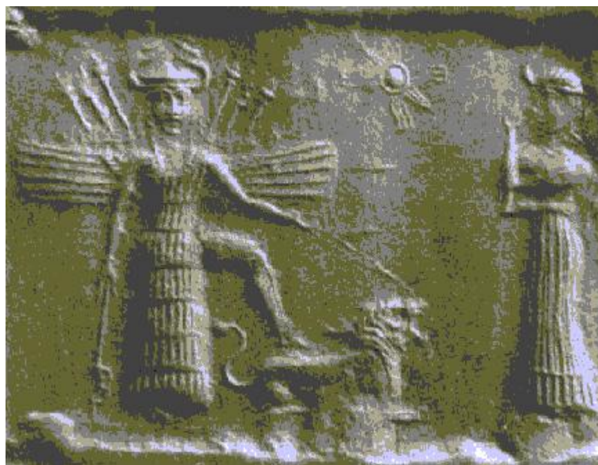
La figure d'Inanna sur une empreinte de sceau-cylindre akkadien daté vers 1334-2154 av. J.C.

* Une documentation importante présente le lion comme l'animal de la déesse INANNA = Istar, dans son aspect guerrier, bien que, dans le texte MUL.APIN , on puisse lire que UR.GU.LA = Latarak qui est une divinité mineure.