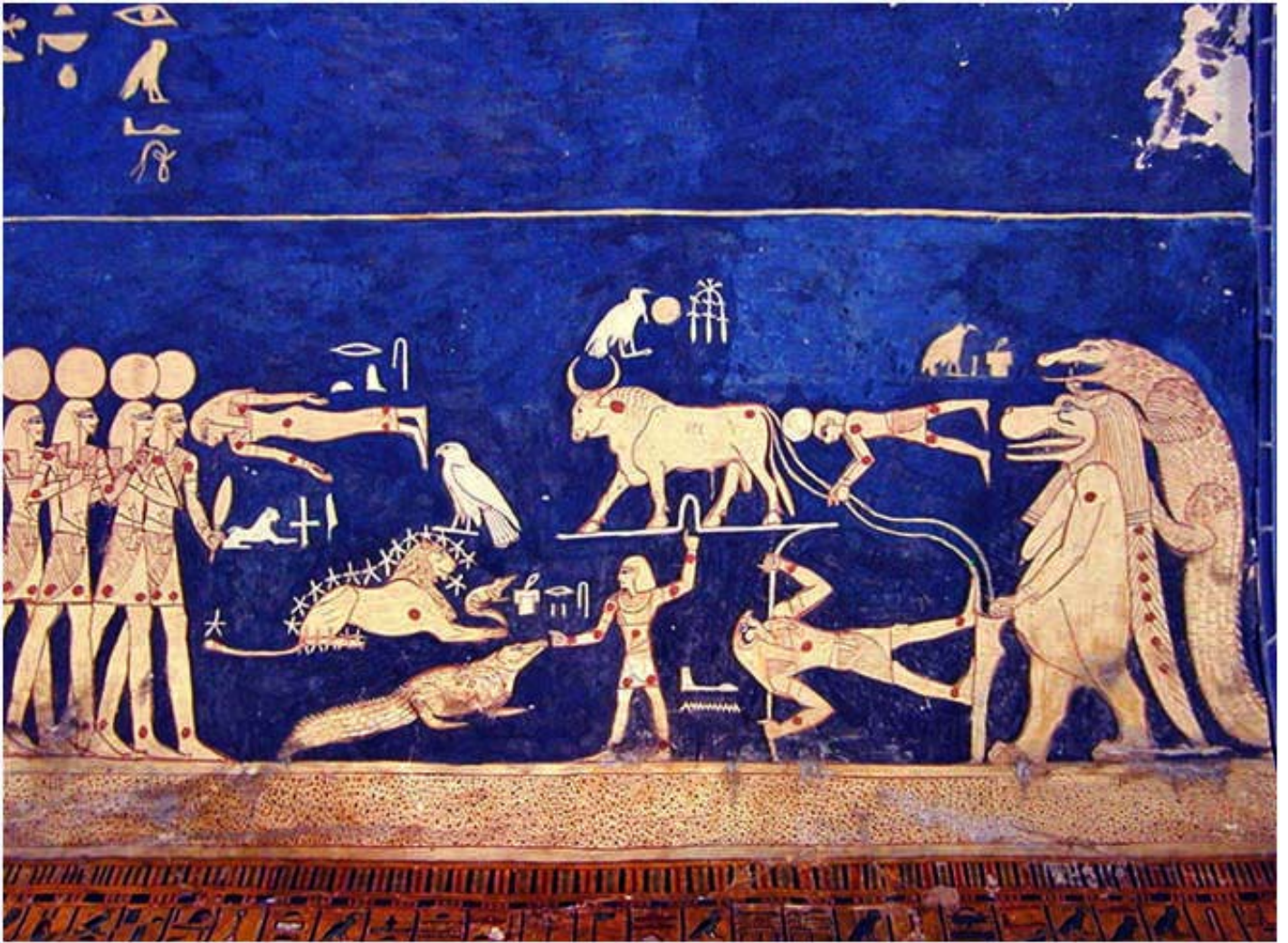
Plafond du temple de Séthi 1 er , 1279 av. J.-C.